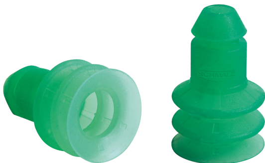
Сильфонные присоски SPB2 P (2,5 гофра)